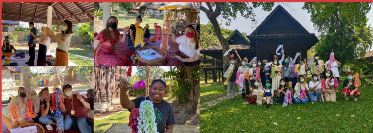
ทำกิจกรรมด้านศิลปวัฒนธรรม ใช้ระยะเวลาโดยเฉลี่ยประมาณ 1 ชั่วโมง